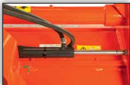
Déport latéral hydraulique de 500mm