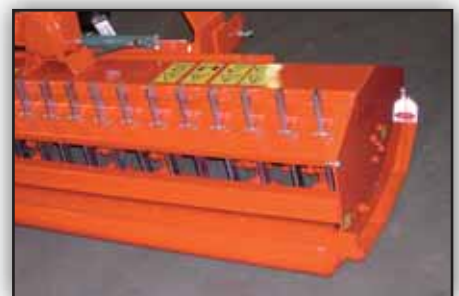
Le SE3000 peut recevoir en option des peignes à sarments afin d'améliorer le broyage.