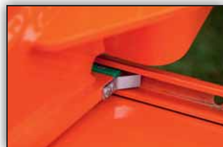
Guides spéciaux en nylon montés sur des glissières afin de permettre un déplacement sans lubrification spécifique.