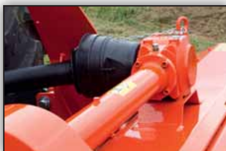
Boîtier pour tracteur jusqu'à 80 CV - Prise de force 540 tr/min - Roue libre intégrée en standard.