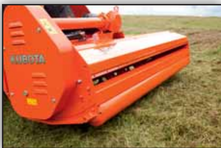
Rouleau arrière Ø 160 mm avec barre décrottoir réglable (équipement standard).